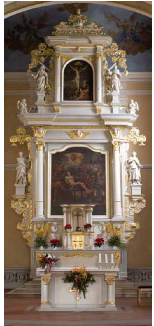
Der Altar von 1670

Im Jahre 1724 feierte die Erzbruderschaft vom allerheiligsten Sakrament (auch sakramentalische Bruderschaft genannt) mit Sitz in Sankt Quintin ihr 100jähriges Bestehen. Die Feiern des 100jährigen Bestehens der Bruderschaft wurden vom Pfarrer und dem Kirchenvorstand, den sog. Juraten, als glanzvoller Erfolg gewertet und man beschloss, einen neuen Hochaltar in der Kirche zu errichten. Denn der alte Altar passte in seiner strengen, nüchternen Manier so gar nicht zu dem zu Prachtentfaltung neigenden Zeitgeist. Ein neuer moderner Altar sollte zeitgemäßen architektonischen Vorbildern entsprechen. Und die bezog man aus Rom, dem Bernini—Altar im Petersdom. So etwas war auch erst vor wenigen Jahren im Würzburger Dom verwirklicht worden: Mächtige und kostbare Baldachine oder Thron—Altäre waren gefragt. Statt Holz war Marmor das bevorzugte Material. Und entsprechend der neuen Spiritualität rückte der Tabernakel aus dem Sakramentshäuschen an der Seite in den Mittelpunkt des Altares. Bereits 1719 hatte der Hofbildhauer Franz Hiernle (1677—1732) einen zum Altar passenden Tabernakel eingebaut. Der Kirchenvorstand ging noch